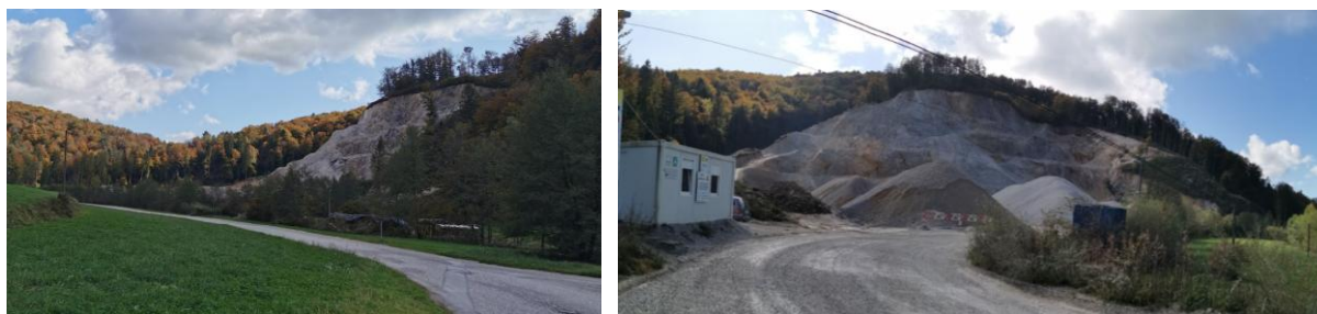
Slika 1: Levo pogled na obstoječi kamnolom z lokalne ceste 426113 in desno pogled na kamnolom z vstopa

Za območje razširjenega kamnoloma se skladno s 129. členom ZUreP-3 pripravi skupen OPPN občin Šmartno pri Litiji ter Ivančna Gorica, ki se pripravlja vzporedno oz. s faznim zamikom z obema postopkoma SD OPN Šmartno pri Litiji ter SD OPN Ivančna Gorica.