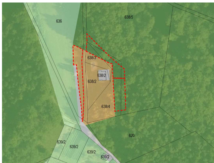
Slika 6: prikaz območja lokacijske preveritve

Dostop do območja posamične poselitve je z javne poti JP 710161 Gradišče. Dostop do območja novogradnje se zaradi terenskih značilnosti uredi iz javne poti ob obstoječem dovozu k posamični poselitvi.