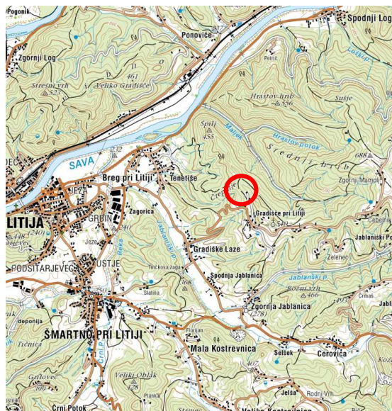
Slika 2: širši prikaz v prostoru – topografija