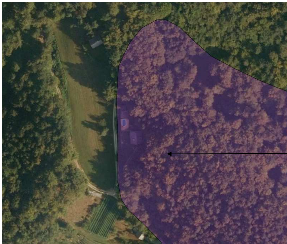
Slika 5: Podatki o prikazu stanja prostora (iObčina, https://www.iobcina.si/ )