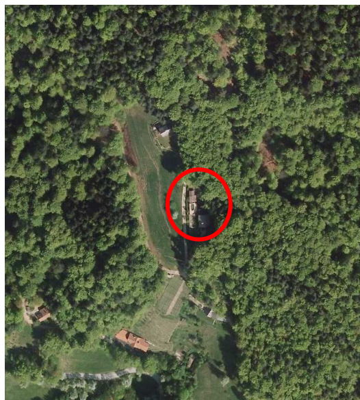
Slika 3: širši prikaz v prostoru – digitalni ortofoto posnetek