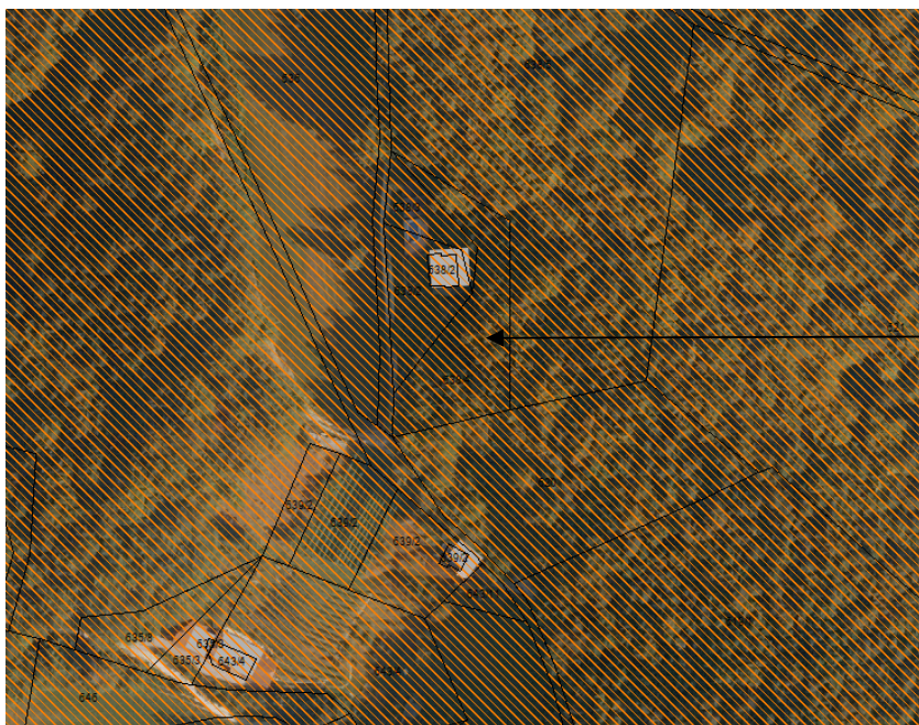
Slika 4: Podatki o prikazu stanja prostora (iObčina, https://www.iobcina.si/ )

Ne nahaja se v območju veljavnih državnih prostorskih načrtov ali v pripravi.