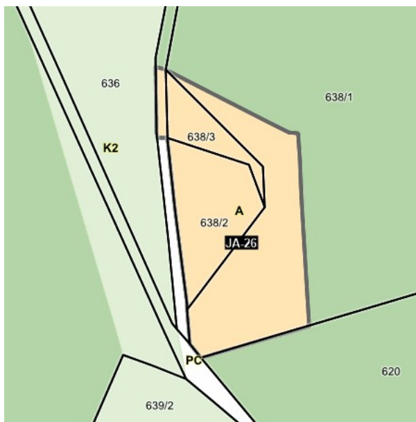
Sprejet OPN na ZKP

Posamezniki bi želeli čim prej graditi na območjih, ki so bila s sprejemom OPN (namenska raba opredeljena na ZKP) določena kot zazidljiva. To je možno izvesti zgolj za območja posamezne poselitve kot lokacijsko preveritev s pomočjo katere se določi obseg stavbnega zemljišča pri posamični poselitvi v skladu z 128. členom ZUreP-2. Enako omogoča tudi 135. člen ZUreP-3. Ker gre v tem primeru za izvedbo lokacijske preveritve kot posledica tehničnih neskladij in zanj posameznik ni moral vedeti, predlagamo da se za ta primer zaračuna taksa v pavšalnem znesku 200 EUR. Lokacijska preveritev se izvede ob upoštevanju zakonskih določil s tega področja.