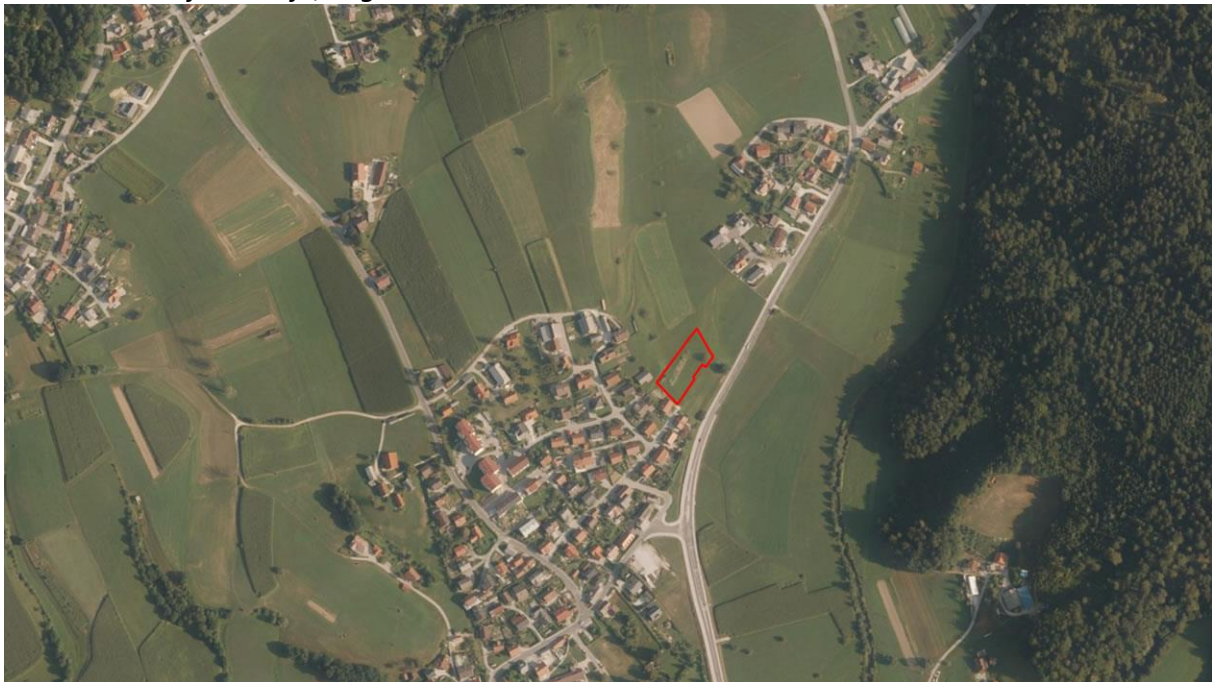
Slika 1: Položaj območja, ki ga obravnava ureditveni načrt