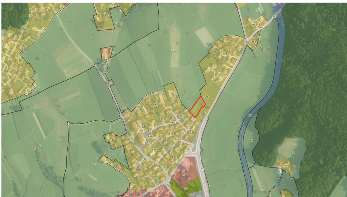
Slika 2: Prikaz namenske rabe za EUP ŠM-4