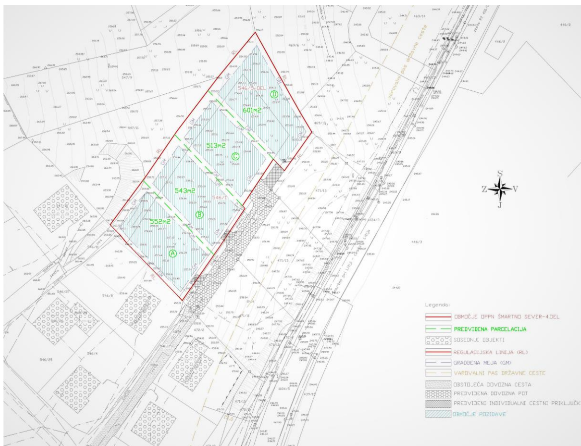
Ureditvena situacija z območjem OPPN