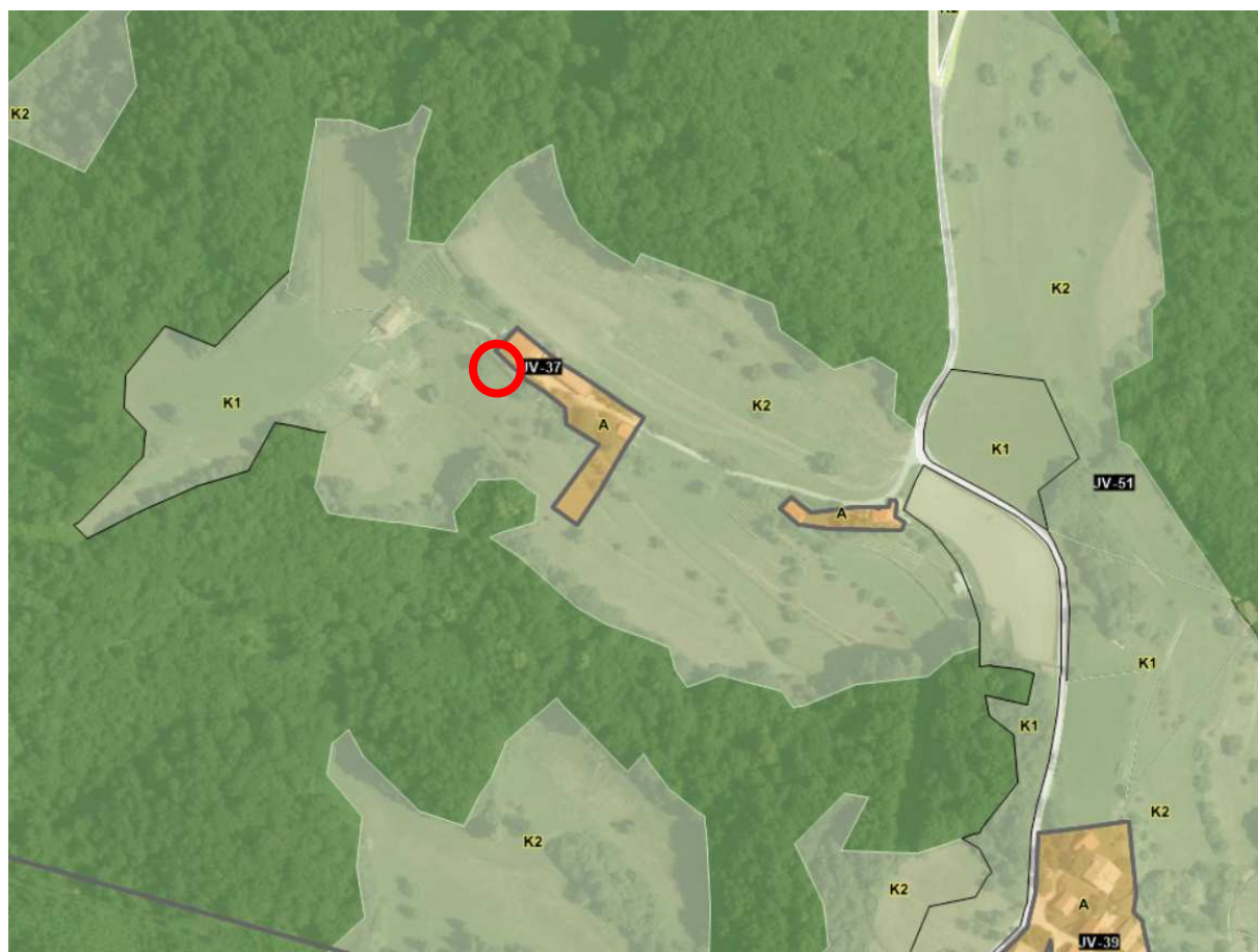
Slika 1: Izrez iz občinskega prostorskega načrta

Na obravnavanem izvornem območju še ni bilo izvedene lokacijske preveritve.