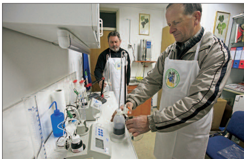
Ureditev prostorov in nabava opreme vinogradniškega društva ŠTUC iz Šmartna pri Litiji

Delati dobro za območje in pri tem spoštovati pobude, ki prihajajo iz terena – to je ključno vodilo LAS »Srce Slovenije«. Center za razvoj Litija že desetletje izvaja programe za spodbujanje razvoja podeželja. Ukrep Leader je eden od finančnih vzvodov za dodatno pomoč našim prebivalcem, društvom, podjetjem.