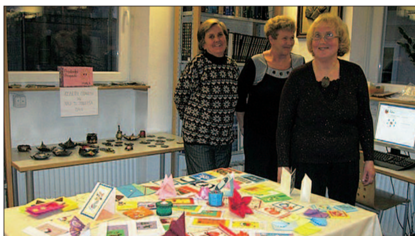
Foto utrinek z razstave vezilj, keramike-članice U3

Delovanje univerze je pestro, tudi v decembru so potekala izobraževanja in delavnice po urniku. Člani krožka Kuhajmo zdravo se bodo sestali 14. decembra ob 17. uri v OŠ Gradec. Predavanje za slušatelje Kulturna dediščina bo 15. 12. Ob 10. uri v Knjižnici Litija. Vse članke pa vabimo na novoletno srečanje z izrednim občnim zborom, ki bo v ponedeljek, 19. decembra ob 18. uri v Kulturnem centru Litija. Oglevali si boste tudi dokumentarni film Po sledih križarjev.