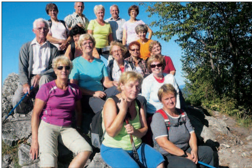
Polhograjska Grmada – najlepši je počitek na cilju