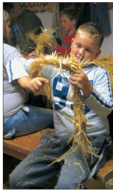
Vse skupaj se je pričelo s slamo.