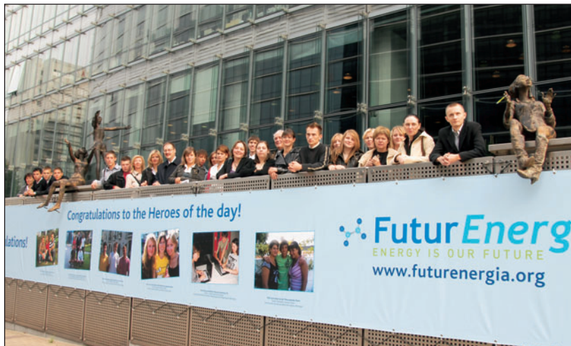
Vse zmagovalne ekipe pred Evropskim parlamentom

Bruselj – Ekipa iz Srednje šole tehniških strok Šiška je s projektno nalogo "Biomasa - cenejše ogrevanje", ena izmed šestih zmagovalnih ekip na mednarodnem natečaju FuturEnergia, ki sta ga organizirala European Schoolnet in PlasticsEurope. Gre za velik uspeh na mednarodnem nivoju, saj je bilo v natečaj vključenih 30 evropskih držav, prispelo pa je 1016 prispevkov.