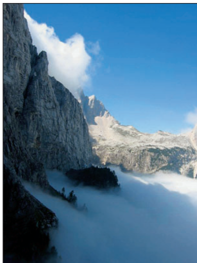
Morje megle je segalo do spodnjih polic Gamsovih riž

sti prva etapa iz Planice v Tamar. Povotno je bila sicer načrtovana zelo zahtevna zadnja, »kraljevska etapa«, ki vodi čez police Luknje peč nad Kotom, vendar nam jo je zagodel sneg, ki je pobelil vrhove. Iz Planice v Tamar poteka široka cesta, po katerih se ob koncu tedna kar valijo trume obiskovalcev, vendar smo se mi le nekaj minut za skakalnicami poslovili od udobnega kolovoza ter se po lovskih stezah, najprej čez bukov gozd nato pa med že zlatečimi se macesni povzpeli do Zgornjega grunta in se čez [krbino Vratca povzpeli na Malo Rateško Ponco (1925 m), s katere se odpira razkošen razgled na velikane nad mangartsko dolino. Pot Planica – Pokljuka sicer ne poteka čez vrh, vendar se zaradi bližine nismo mogli upreti skušnjavi. Žal so bili najvišji vrhovi v oblakih, kljub temu pa je bilo slutiti, kako imeniten je razgled z vrha, zato smo si obljubili, da se sem še kdaj vrnemo. Lepo jesensko doživetje je bilo tudi nadaljevanje poti čez Glave in Ovčjo stran. Pot se vije nad strmimi pečinami.