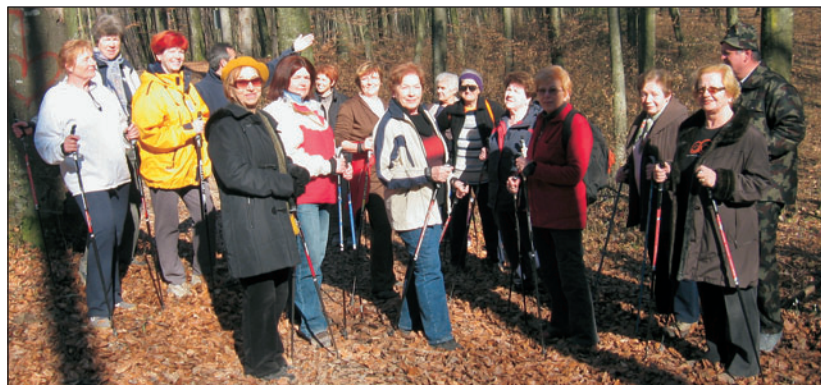
Na cilju Jurčičeve poti

Pester program našega društva je poskrbel, da v prvem polletju ni bilo nikomur dolgčas. Organizirali smo srečanje zasavskih diabetikov na Vačah, o katerem smo vam že poročali. Udeležili smo se športno – rekreativnega srečanja diabetikov v Slovenj Gradcu, hodili po Jurčičevi poti, obiskali Grossglockner. Izvedli smo tudi vse ostale dejavnosti. Pripravljamo pa se že na pestro jesen, ki nam bo prinesla organizacijo državne proslave ob dnevu sladkorne bolezni.