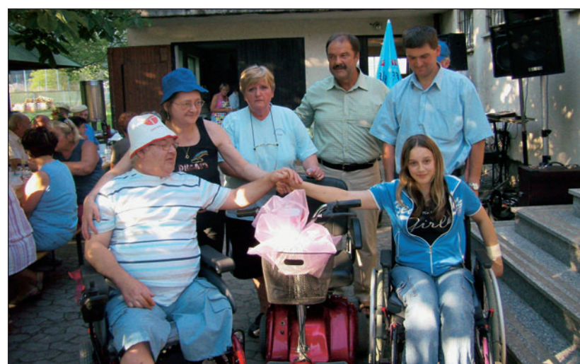
Izročitev vozičkov našima invalidoma na srečanju 28. junija 2008

MDI Litija – Šmartno se v imenu invalidov obeh občin zahvaljuje vsem, ki so se odločili del svoje dohodnine nameniti invalidom.