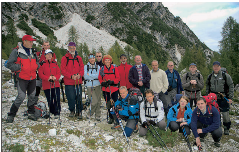
Počitek pod stenami ponc