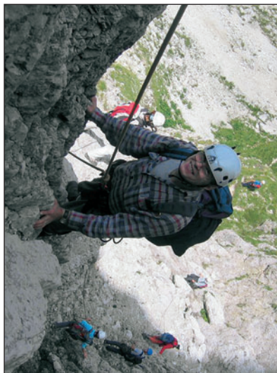
Na ključnih mestih ne gre brez alpinističnih spretnosti