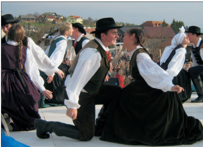
Levstikovega pohoda ni brez folklornih plesalcev