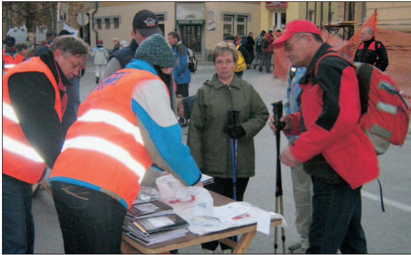
Prvi pohodniki so se na pot podali še v mraku

Letošnjega jubilejnega 20. popotovanja po Levstikovi poti se je udeležilo okrog 15.000 udeležencev iz celotne Slovenije. Priložnost smo se imeli pogovarjati celo z udeleženci iz Amsterdama, ameriškega Teksasa in Brazilije. V 20 letih so pohodniki prehodili okrog 4,4 mio. kilometrov kar predstavlja šestkratno pot do lune in nazaj.