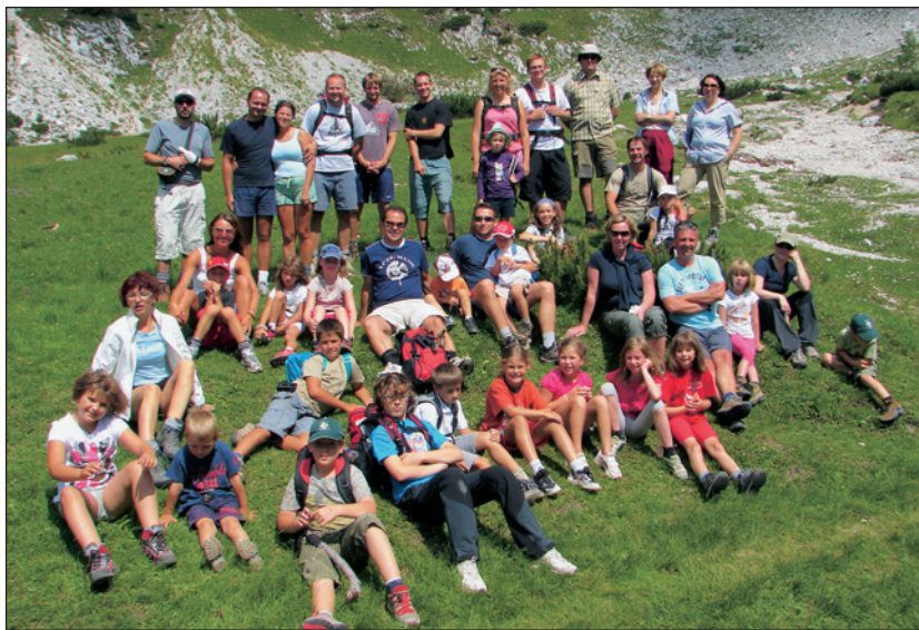
Fotografija družinskega planinskega tabora

Od 25. 7. 2010 do 1. 8. 2010 je ob Nadiži v bližini Podbele potekal 1. študentski planinski tabor. Udeležilo se