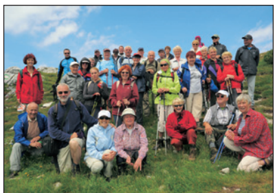
Skupinska s Pece

Planinska sekcija DU je imela v poletni sezoni številne izlete na dvatisočake. Eden od njih je bil tudi izlet na Peco. Na Kodrževo glavo so se podali od zgornje postaje gondolske žičnice na