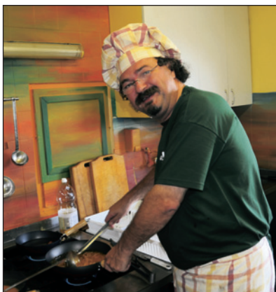
Nov oskrbnik doma na Jančah