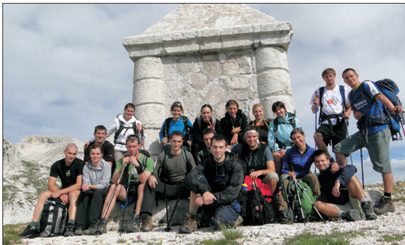
Fotografija študentskega tabora