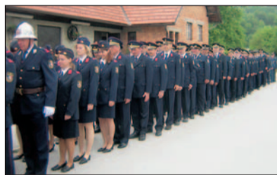
Srečanja se je udeležilo 84 uniformiranih gasilcev

Potekalo je v nedeljo, 6. maja. Naj že na začetku napišem, da je to prvo srečanje, ki poteka pod okriljem GZ Šmartno, saj smo se že vrsto let ob prazniku našega zavetnika sv. Florjana srečevali na tovrstnih srečanjih, ki pa jih je organiziralo PGD Šmartno. Zaradi vse večje udeležbe je padla pobuda, da ta dan organizira GZ Šmart-