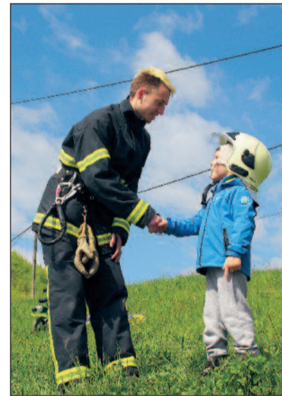
Gasilci in mladi z roko v roki!

Prostovoljno gasilsko društvo Primskovo je 19. marca organiziralo največjo gasilsko vajo doslej. Na njej so poleg domačih gasilcev sodelovali gasilci PGD Kostreznica ter tri reševalne ekipe, dve iz ZD Litija in ena iz ZD Hrastnik. Sodelovala sta tudi policista Policijske postaje Litija.