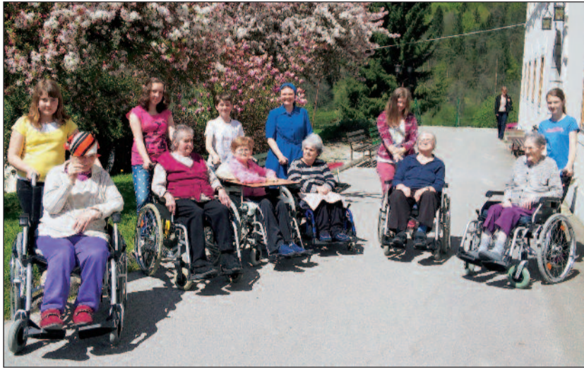
Pomladno sonce je godilo vsem. Tako mladim kot starejšim.

V domu že vrsto let negujemo in spodbujamo prostovoljce ter skrbimo za pozitivno podobo prostovoljskega dela, ki je pomemben člen pri skrbi za dobro počutje stanovalcev. Medgeneracijsko sodelovanje prispeva tudi k sožitju in povezovanju ljudi v širši skupnosti. Prostovoljsko delo po svoji svobodni odločitvi in brez materialnih koristi opravlja posameznik v dobro drugih ali za skupno javno korist (vir: Etični kodeks organiziranega prostovoljstva).