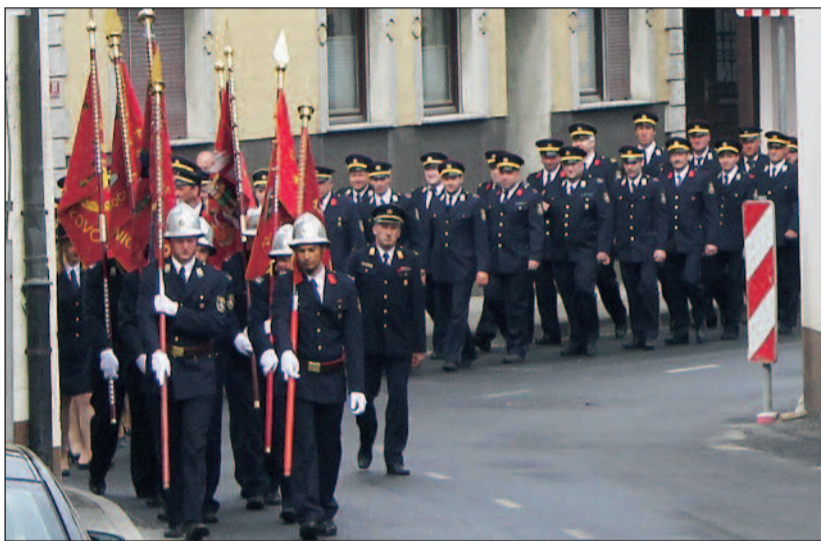
Mimohod slovesno opremljenih gasilcev po šmarskih ulicah

Tudi letos smo se v nedeljo, 3. maja, zbrali skupaj z člani posameznih gasilskih društev Šmarke gasilske zveze v župnijski cerkvi in počastili god sv. Florjana – zavetnika gasilcev.