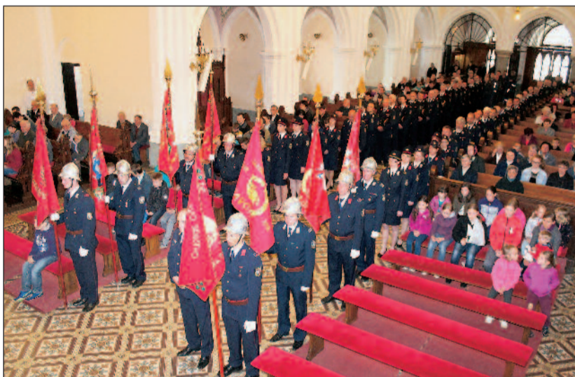
Slovesnost v počastitev sv. Florjana se je dogajala v šmarski cerkvi

»Jaz sem trta, vi mladike...« so Svetopisemske besede, ki smo jih slišali to nedeljo. Niso le razlaga o povezanosti med Bogom in kristjani, temveč so lahko tudi prispodoba, kako zelo je pomembna tesna povezanost. Nesebična dobrota gasilcev se izkaže prav v težkih trenutkih preizkušanj, kjer so ravno gasilci prvi, ki se žrtvujejo za sočloveka, pogostokrat tudi do zadnjih svojih moči. Naj bodo usliša-