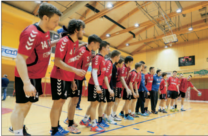
Članska ekipa RD HERZ - Šmartno

V maju se počasi zaključuje državno prvenstvo v 1.B ligi. Do konca sta še dva kroga, ekipa RD Herz Šmartno pa trenutno zaseda 3. mesto, tri točke pred RK Dol TKI Hrastnik. V maju zaključujejo s tekmami tudi mlajše selekcije. Najuspešnejša bo na koncu ekipa mlajših dečkov A, ki se bo udeležila finalnega turnirja od 5. do 8. mesta.