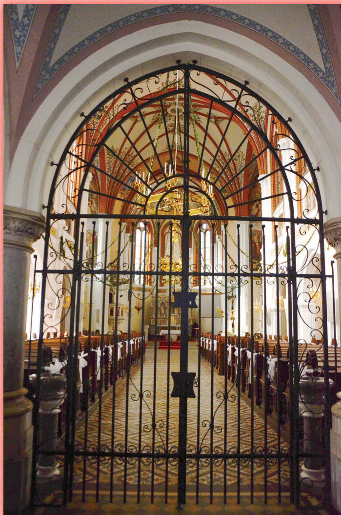
Žiga Cvikl, Vstopi

Ob začetku prve svetovne vojne je tako šmarska cerkev kazala skoraj enako podobo kot danes.