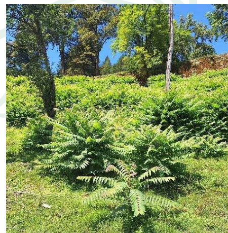
Veliki pajesen