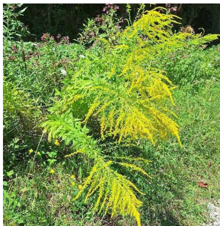
Kanadska zlata rozga