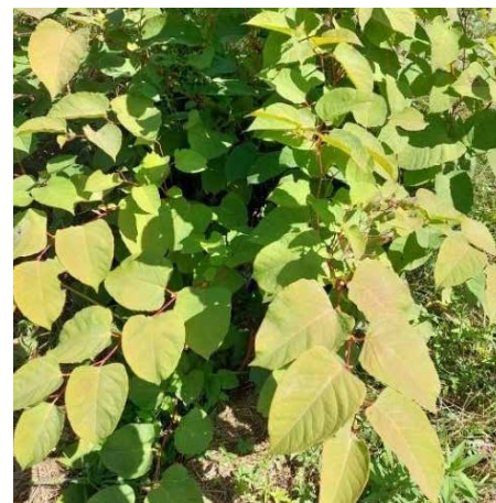
Japonski dresnik