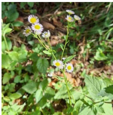
Enoletna suholetnica

Izpostava Litija Valvazorjev trg 3, 1270 Litija