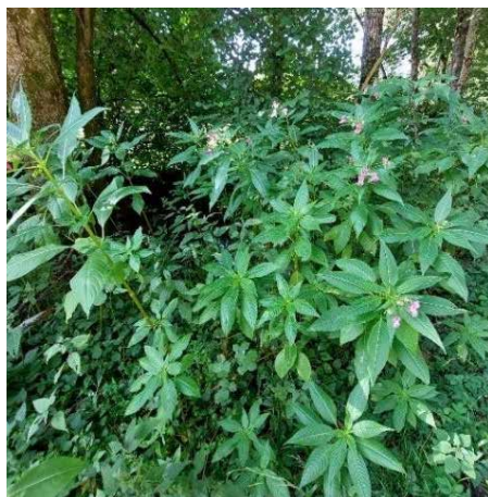
Žlezava nedotika