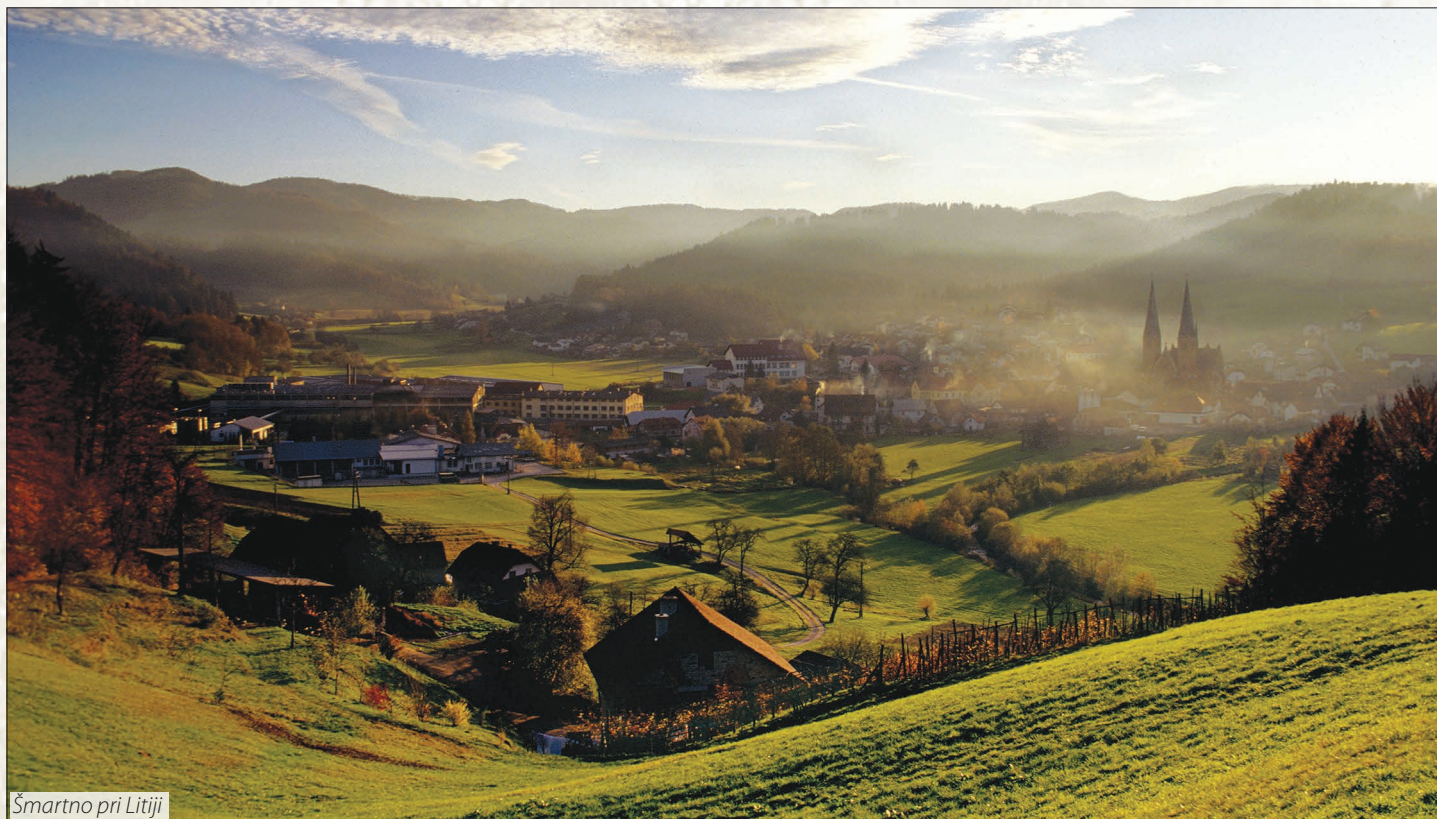
Šmartno pri Litiji