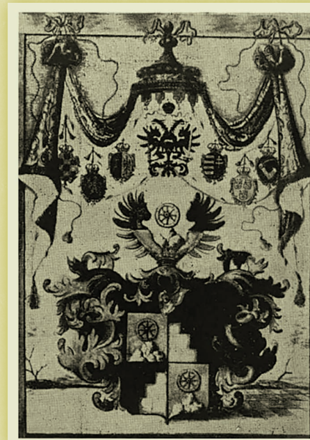
Grb Bogatajev iz plemiške diplome

Ignac Bogataj je umrl zaradi pljučnice leta 1852, njegova žena pa le dobre tri mesece za njim. Pokopana sta na šmar­skem pokopališču, kjer je ohranjen njun nagrobnik. Hčere so grad leto pozneje prodale knezu Weriandu Windischgraetzu. Danes na gradu Bogenšperk le malo ohranjenih stvari spominja na Bogataje. Njim bi lahko pripisali ohranjene empirske peči iz prve polovice 19. stoletja, na stebri Valvasorjeve sobe pa je ohranjen