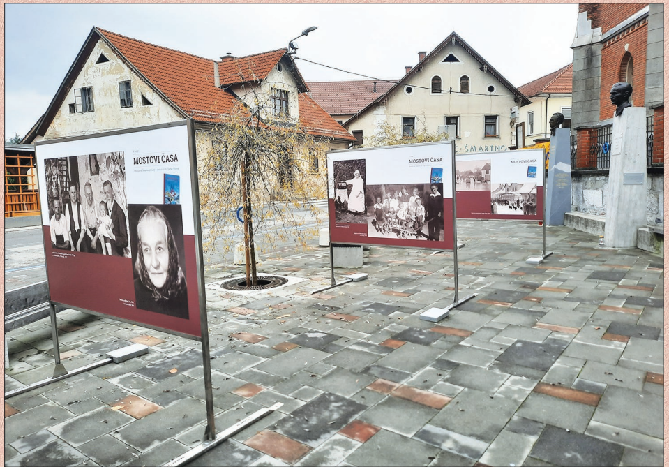
Fotografije iz knjige Mostovi časa so vabile na predstavitev in k branju, Staretov trg, november 2021.

Pripovedovalci, s katerimi sem se srečevala, se zavedajo pomembnosti slikovne in pisne zapuščine. Nekateri hranijo tudi podarjene dragocenosti svojih že umrlih sorodnikov in razmišljajo, komu bi jih zapustili. Žal pa je večina očuvanega gradiva, predvsem mislim na fotografije, slabo dokumentirana s pripisom o času nastanka in vsebini posnetka. Slikovno gradivo sem iskala tudi mimo pripovedovalcev. Tega ni nikjer kar