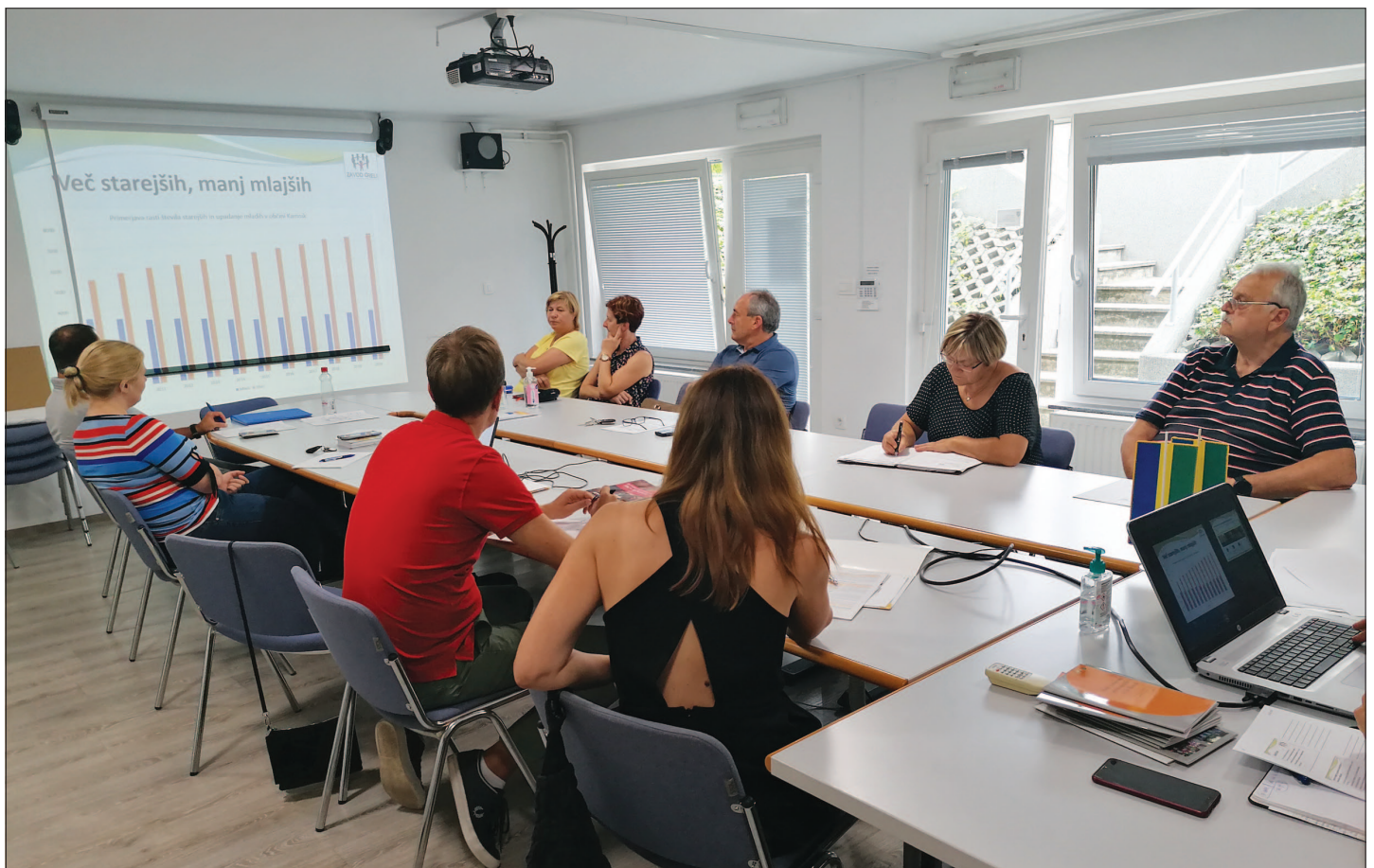
Srečanje s potencialnimi partnerji projekta za starejše, Dol pri Ljubljani, 26. 8. 2020

Naslednja aktivnost projekta EU_SHAFE je srečanje deležnikov v maju 2021, na katerem bodo predstavljene evropske dobre prakse na temo komuniciranja in informiranja.