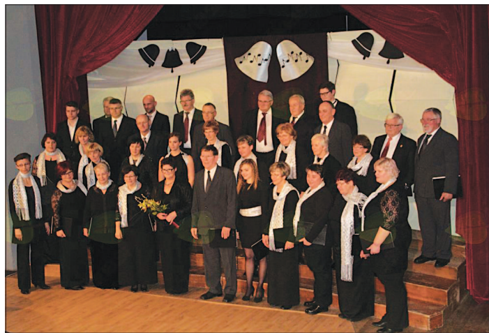
Zvon, 17. 2. 2018

Naša velika želja je, da bi se zdravstvena slika čim prej obarvala v barvo, ki omogoča nastanitev gostov in s tem sprejem učencev. Že sedaj pa vabljeni, da svojo nadobudno mladež prijavite na polletne aktivne počitnice Čateške dogodivščine in Angleščini naproti, med katerimi bomo s pestrim naborom dejavnosti pričarali poučne, ustvarjalne, sproščujoče športno-zabavne počitnice. Več na spletni strani www.csod.si , na kateri si ob kliku na izbrani termin počitniškega tabora doma Čebelica, lahko preberete informacije o programu.